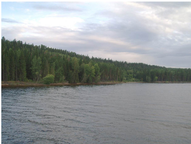
Рис. 5. Низкий пологонаклонный (2–5°) берег затопления (поймы, надпойменных и оползневых террас, других элементов речной долины)

Таким образом, в береговой зоне Ножовского ландшафтного района получили развитие 7 групп береговых урочищ, представляющих собой комбинации из типов и родов урочищ (табл. 1, рис. 6).