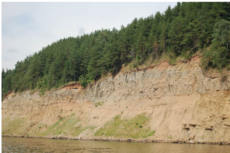
Рис. 3. Абразивные хорошо дренируемые уступы высотой более 2 м коренных относительно крутых (до 60–70°) склонов долины