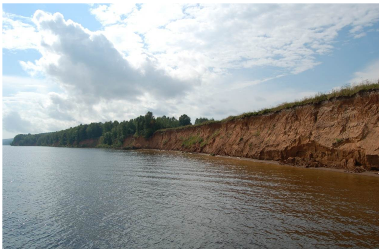
Рис. 2. Абразионные хорошо дренируемые уступы пологонаклонных надпойменных террас высотой более 2 м