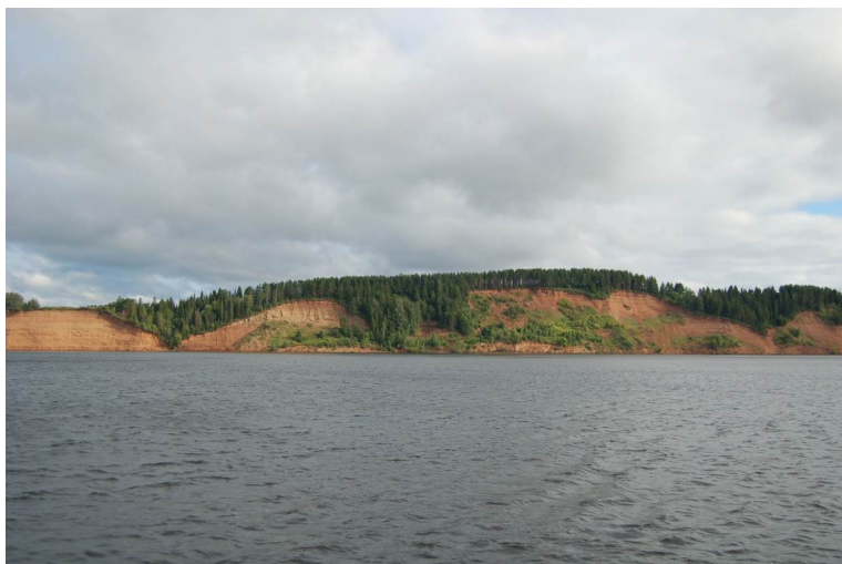
Рис. 4. Абразивные хорошо дренируемые уступы нижних оползневых блоков (ступеней) коренных склонов долины