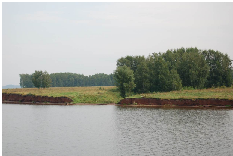
Рис. 1. Абразионные слабодренируемые уступы пологонаклонных надпойменных террас высотой менее 2 м