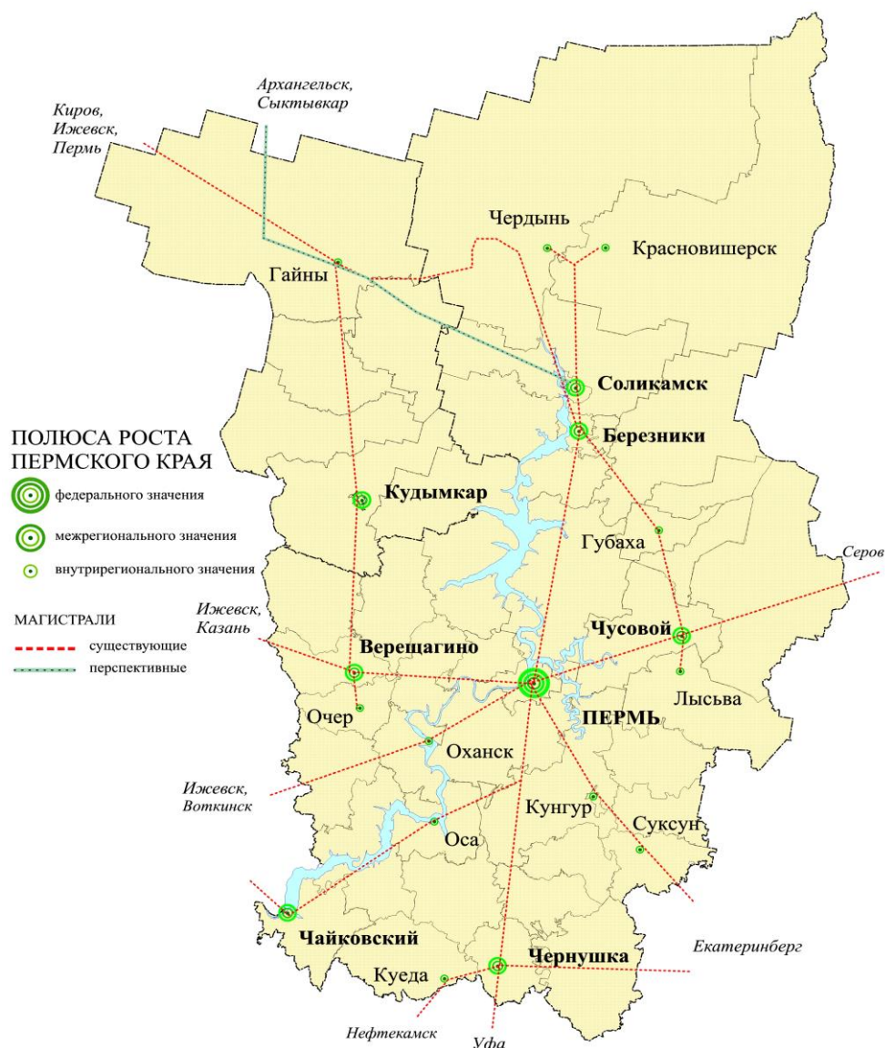
Рис. 2. Полюса развития Пермского края

Так, центр страны или ее отдельного субъекта выступает в качестве полюса роста общероссийского и международного масштаба по ряду функций: политико-административные, международные инновационно-образовательные, инновационно-информационные, инновационно-культурные, инновационно-оздоровительные, транспортно-логистические и др. Здесь должен быть расположен ряд межотраслевых комплексов, осуществляющих функции организационно-обслуживающего межрегионального (межсубъектного) центра (рис. 2).