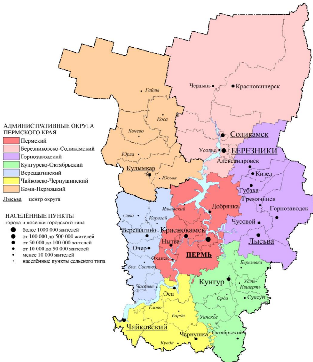
Рис. 3. Социально-экологические микрорайоны Пермского края

Развитие таких крупных городов неизбежно будет способствовать развитию прилегающих регионов, в том числе и депрессивных территорий, ресурсы которых сразу будут востребованы;